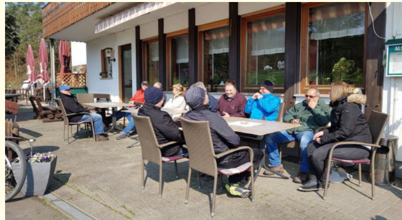
5. Begehung am 14.04.2019