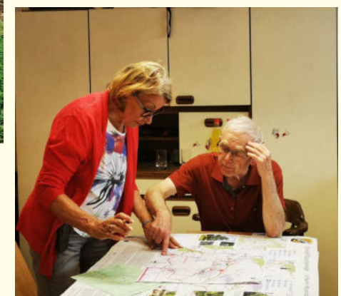
Ausarbeitung der Tafeln und Karten, Gestaltung der Internetauftritte