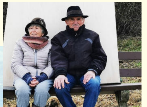
Bestehende Bänke verbessern