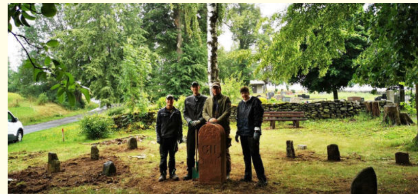
Grenzsteinlapidarium in Hergersdorf aufbauen