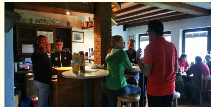
Bewirtung bei der Eröffnungswanderung am 29.10.2023