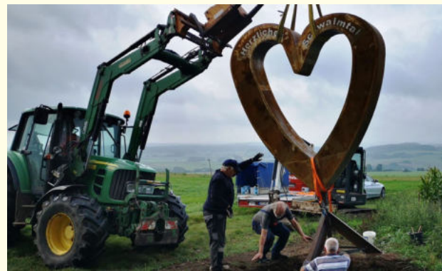
Immer unterstützt durch Bauhof und Bürgermeister