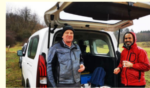
Erste Vorbereitungen am 26.02.2021