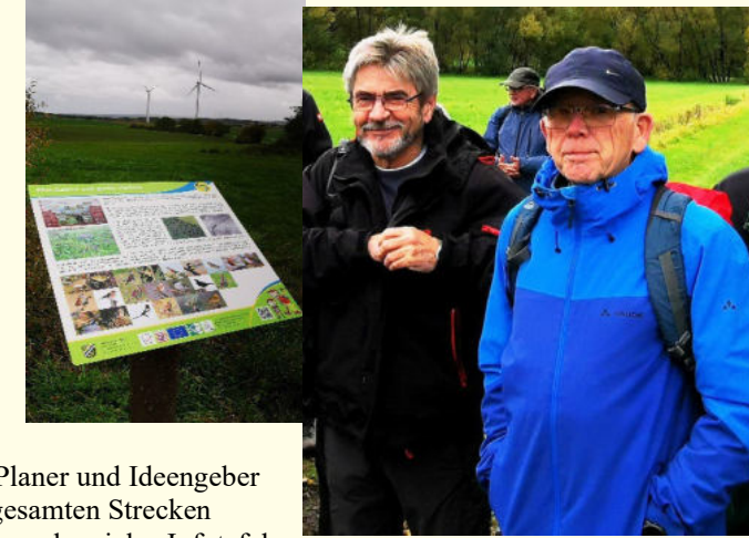
Die Planer und Ideengeber der gesamten Strecken Autoren der vielen Infotafeln