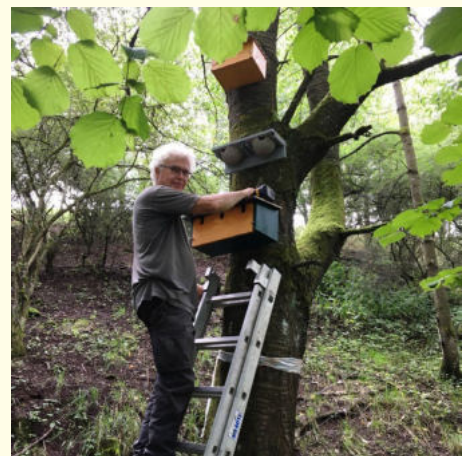
Nistkästen am Kählsorn aufhängen