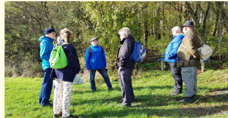
6. Begehung (des Panoramaweges am 3.11.2019)