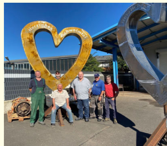
Von Fa. Stehr gespendetes Schwalm-Tal-Herz