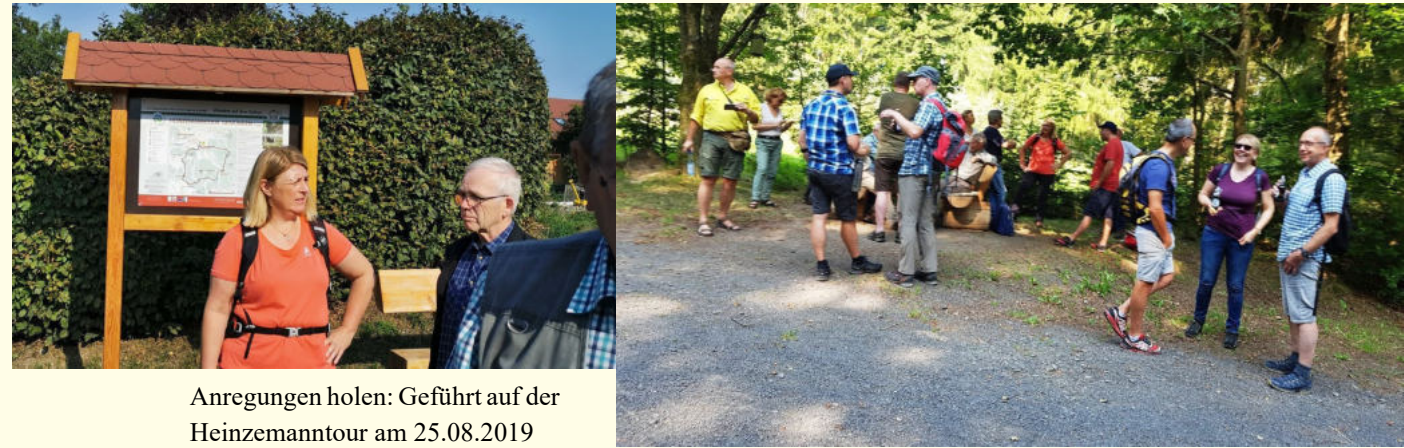
Anregungen holen: Geführt auf der Heinzemantour am 25.08.2019