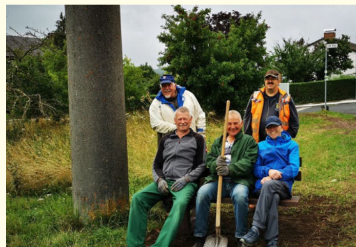
Aufbau der Einrichtung nur möglich durch den Einsatz des „Dream-Team“