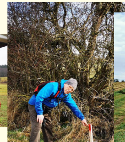
Routen festlegen im Gelände