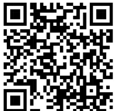
QR-Code Höhen -Tour