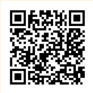
QR-Code Wald -Tour

Ziel: Mehrgenerationenplatz – zum Spielen und Turnen